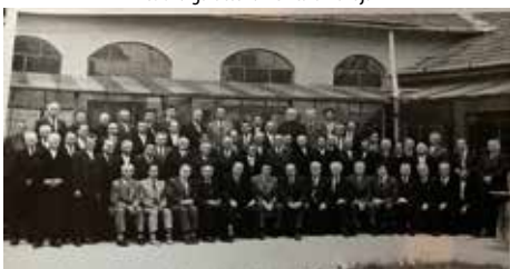
1977 – Arad, az egyházközség lelkipásztorainak és szolgálattevőinek találkozója