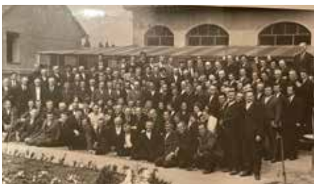
1976 – Arad, a Bánáti Egyházközség lelkipásztorainak és szolgálattevőinek találkozója