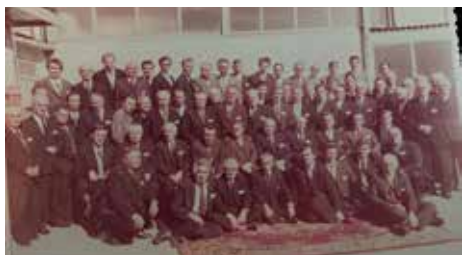
1984 – a Temesvári Egyházterület választási közgyűlése