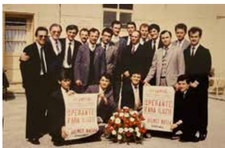
1991 – lelkipásztorok a Helmuth Mayer által tartott evangelizáción

Új kórusok és zenekarok jönnek létre, ami az új gyülekezetek és csoportok megalakulásának is köszönhető. Míg 1990-ben 45 gyülekezetünk volt, ez a szám mára megháromszorozódott: az öt megyében 108 gyülekezet és 43 csoport működik. Bár igaz, hogy több száz tag kivándorlása, vagy a fiatalok városokba költözése bizonyos helyeken negatív hatással volt a mű előrehaladására – ami miatt néhány kisebb gyülekezetet be is kellett zárni –, mégis vigasztal a tudat, hogy az elköltözött személyek immár új közösségek fellendítéséhez járulhattak hozzá.