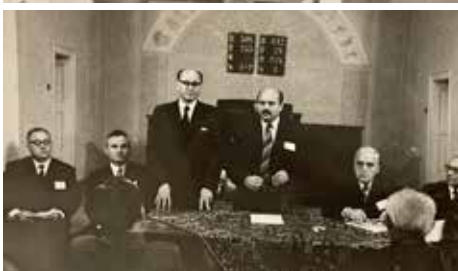
1975 – Nagyszeben, a Nagyszebeni Egyházközség választási közgyűlése