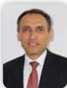
Gabriel Ban tag