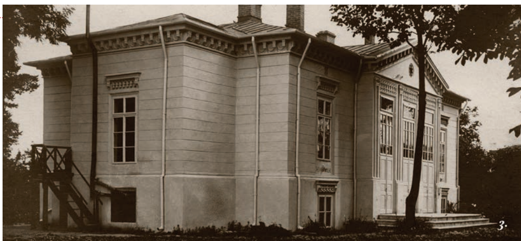
A Focşani-i Bibliaintézet

Ezért egy sokkal tágasabb, immár 30 hektáros területet vásároltak a Brassó melletti Méhkertben, ahol csupán 6 hónap alatt felépítettek egy modern és gyakorlati célok- nak is megfelelő épületet. 1931 novemberében már meg is kezdődhetett a tanítás az új helyszínen. Méhkert 18 évre (1931–1949; kivételt képez az 1942–1945-ös időszak) a