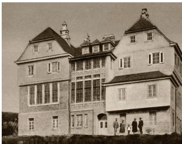
A dicsőszentmártoni Bibliaintézet

A hatóságok azt ígérték, hogy az immár 1948-tól Adventista Teológiai Szeminárium név alatt működő intézmény Bukarestben újrakezdhethi működését. Ezt azonban folyton elhalasztották, s így csak 1951-ben indulhatott újra a tanítás. Új korszak kezdődött az adventista oktatás történelmében.