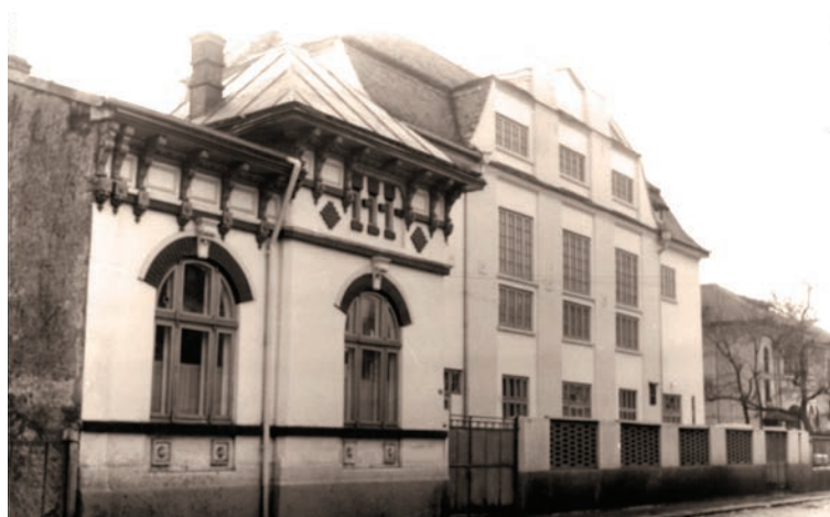
A bukaresti (Labirint) Adventista Teológiai Szeminárium

AZ ADVENTUS EGYETEMET VÁLASZTÓ DIÁKOK ADVENTISTA ÉRTÉKEKRE ÖSSZPONTOSÍTÓ KÉPZÉSBEN, ELKÖTELEZETT TANÁRI KARBAN ÉS LELKI FEJLŐDÉST ELŐSEGÍTŐ LÉGKÖRBE RÉSZESÜLHETNEK. AZ ORSZÁGON BELÜLI ÉS A HATÁROKON TÚLI MISSZIÓS TEVÉKENYSÉGEK, KIRÁNDULÁSOK, ÉS A FOLYAMATOS LELKI TEVÉKENYSÉGEK TESZIK AZ EGYETEMI ÉLETET OLYANNÁ, MELY BIZTOS ALAPOT SZOLGÁLTAT AZ ÖRÖK ÉLETRE SZÓLÓ ELKÖTELEZŐDÉS SZÁMÁRA.