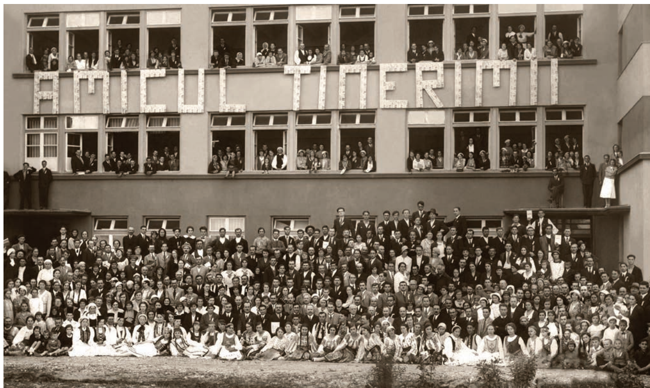
Ifjúsági kongresszus a méhkerteri Bibliaintézetben (1934)

Az elnyomás időszaka azonban az isteni gondviselés nyomát viseli. Ebben az időben a szeminárium tevékenységét olyan tanárok támogatták, akik Méhkertben is tanárként vagy épp diákként tevékenykedtek. Ők még a régi misszióiskola lelkületével és látásmódjával rendelkeztek. A diákok különös vonzalmat éreztek az egyházi értékek iránt, és a nehézségek ellenére is készek voltak bármit megtenni küldetésük teljesítéséért. Az ebben az időszakban végzett diákok odaadóan és hűségesen szolgálták az egyházat mind a megszorítások idején, mind az 1989 utáni szabadság éveiben. Isten gondoskodásának köszönhetően a teológiai szeminárium még a hatósági elnyomás és