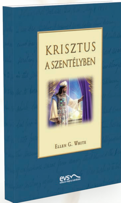
Ellen G. White: Krisztus a szentélyben