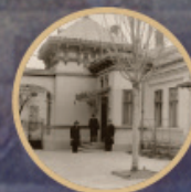
1951 Seminarul Teologic Adventist București - Labirint