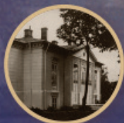
1924 Institutul Biblic Focșani