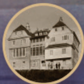
1926 Institutul Biblic Dicosânmartin (Târnăveni)