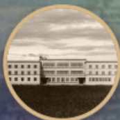
1931 Institutul Biblic Stupini