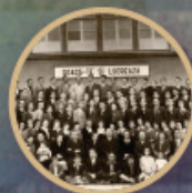
1945 Institutul Biblic Stupini