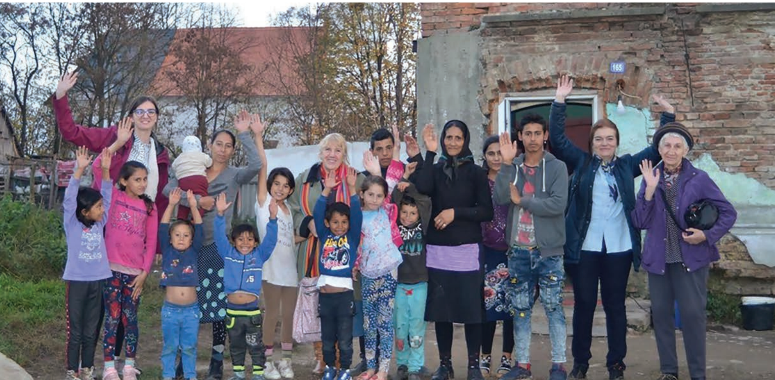
A fogvatartottak gyermekeinek szervezett találkozójának vége az egyik Kovászna megyei faluban

Azok, akik a teljes anyagot lemásolják, jutalomként egy magánlátogatásban és csomagban részesülnek. Ezáltal az emberi kapcsolataikat is ápolják.