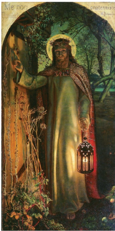
William Holman Hunt: A világ Világossága (1853–1854)

„Ímé az ajtó előtt állok és zörgetek” – hangzik Krisztus intó szava napjaink keresztény társadalmához is. A krisztusi szó azonban még mindig süket fülekre talál, a szívek zárva vannak, az ajtókon nincs kilincs. A világ arculata sajnos alig változott. Az árnyok ugyan eltolódtak, de a lényeg ugyanaz maradt. Bármerre nézünk, bárhova tekintünk, a krisztusi szívet, a krisztusi szeretetet nem találjuk sehol. A mai világ embere is hamis istenek pogány oltárain áldoz. Ézsaiás próféta szava még mindig időszerű: „Tapogatózunk, mint vakok a falat, és tapogatózunk, mint akiknek szemük nincs, megütöközünk délben, mint alkonyatkor, és olyanok vagyunk, mint a hallottak az egészségesek között” (Ézs 59:10).