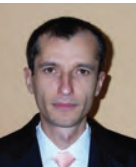
PROFETIKUS TÁVLATOK MUGUREL ASAFTI

A földi életben, a társadalmi és gazdasági kapcsola- tokban szükség van arra, hogy a jövőbe tekintsünk, és előrelátó forgatókönyveket dolgozzunk ki. Bár nem ismer-