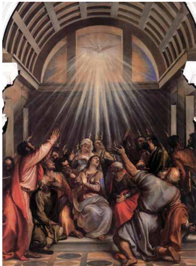
Tiziano: A Szentlélek eljövetele