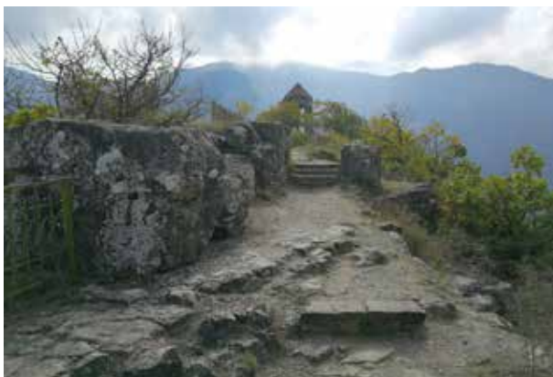
Az Ararát-hegy, Obszervatórium, Jáfet köve.