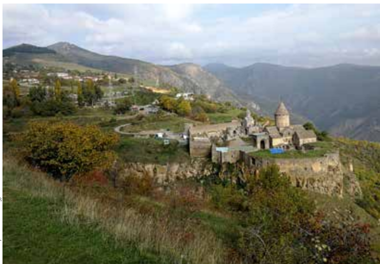
Tatev templom, Ararat-hegy.