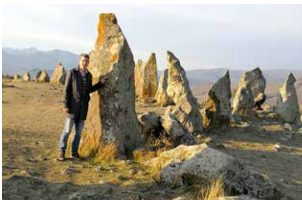
Az Ararát-hegy, Obszervatórium, Sém köve.

A kőtömbön ismert bibliai jelképek láthatók: bárka, galamb, holló, emberábrázolások (Sém, Khám és Jáfet, Noé neve), Ararát (Urartu), a mindent látó mennyei szem Jehova nevével, stb. Ezek a kőrajzok megcáfolatlanul az özönvizet ábrázolják, és feltehetően Noé utódai a szerzői.