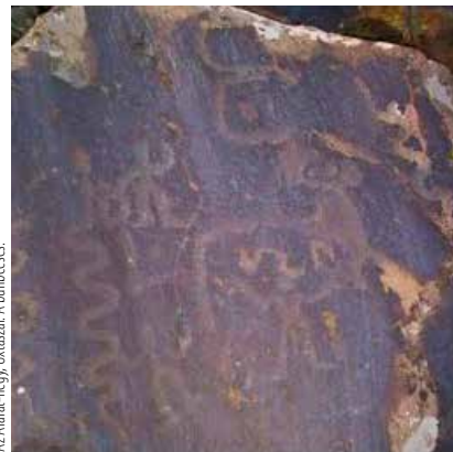
Az Ararát-hegy, Uxtasar, a kúthéves.

Néhány kilométerrel odébb, a hegyek között kígyózó úton jutottunk el az „Obszervatóriumhoz”. Lélegzetállító a kilátás. Sajnos az örmény népihit idején az örmény asszonyok gyermekeikkel a karjaikban innen vetették magukat a mélybe, hogy ne a törökök végezzenek velük. Ez a hely bibliai időköt idéz. Egy felső földrétegből származó kővön feltűnik a Jáfet neve is.