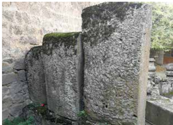
Az Ararát-hegy, Sém, Khám és Jáfet köve.

A „Patriárkák és próféták” című könyvben fontos részletre derül fény Noé bárkájával kapcsolatban: „Ahogy a víz apadni kezdett, az Úr a bárkát egy hegyecsoporthoz által védett helyre sodortatta. Ezeket a hegyeket Isten hatalma megőrizte. Ebbe a csendes kikötőbe érkeztek, és nem sodródtak többé a végtelen óceánon” (Ellen G. White, Patriárkák és próféták , 105. o.). Habár ez a leírás nem képezhet sem archeológiai, sem geológiai, sem történelmi alapot, mégis azt sugallja, hogy Noé bárkáját Isten kötötte ki, hiszen nem volt horgonya, a kikötőt pedig egy több hegyből álló hegység jelentette. Az Ararát két csúcsa nem képezhetett „kikötőt”. Ezzel szemben 48 kilométerre az Araráttól és Jerevántól, az Aragatz hegységben több hegyrom is van, amely ilyenformán megfelelhet ennek a leírásnak. Az Aragatz hegységben, 3000 méteres magasságban Shea még 2004-ben felfedezett egy 1,8 × 1,2 méteres kőtömböt, amelyen hieroglifák és sziklarajzok találhatóak. Ez az alfabetikus írás az egyiptomi hieroglifákkal együtt a proto-sínai íráscsaládhoz tartozik, időben Kr. e. 2000–3000-re tehető.