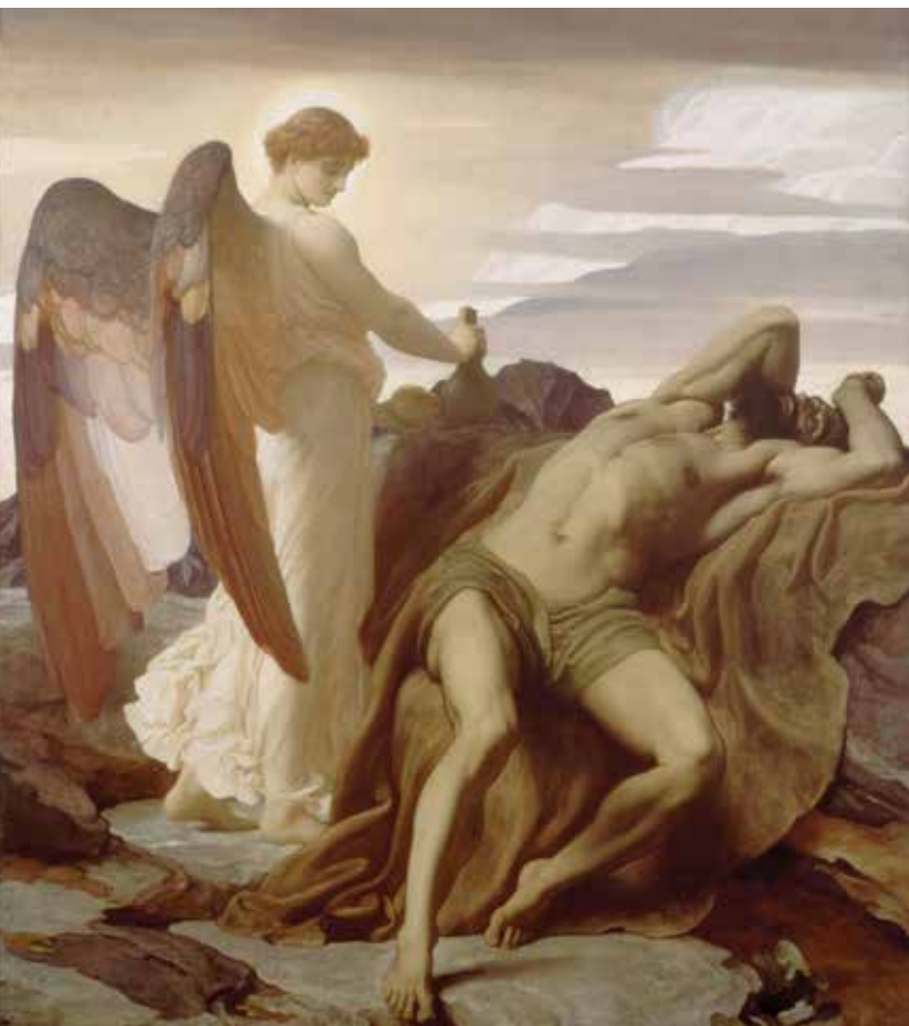
Frederic Leighton: Illés a pusztában

MINDEN EMBERNEK ALÁ KELL VETNIE MAGÁT ISTENNEK, ÉS SAJÁT CSELEKEDETEI ÁLTAL MEG KELL TAPASZTALNIA A KEGYESSÉG TITKÁT.