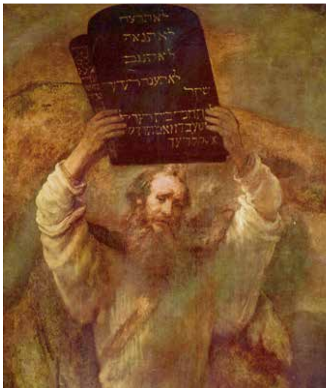
Rembrandt: Mózes a kőtáblákkal, 1659

A Biblia valóban említést tesz több szövetségről: az emberrel az Édenben kötött szövetség (1Móz 3:15); a Noéval és családjával kötött szövetség az özönvíz után (1Móz 9:8-17); az Ábrahámmal kötött szövetség (1Móz 12.1-3; 15:18-21); az Egyiptomból kivonult Izraellel a Sínai-hegynél kötött szövetség (2Móz 24:3-8); a Jordánon átkelt és a Kánaán bevétele előtt álló néppel kötött szövetség (Józ