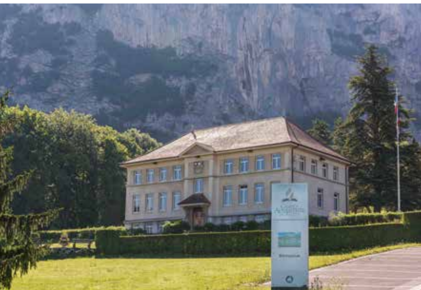
A Salève-i adventista kollégium (Franciaország)