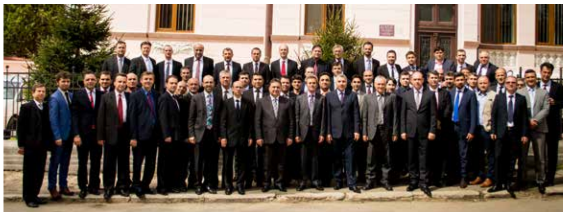
Az Olténiai Egyházterület lelkészakara 2016 áprilisában.

5. Az ortodox vallású népesség aránya, megyénként: Olt – 99,4%; Vâlcea – 99,1%; Dolj – 98,9%; Gorj – 98,4%; Teleorman – 98,3%; Argeș – 97,9%; Mehedinți – 97,3% (a 2011-es népszámlálási adatok alapján).