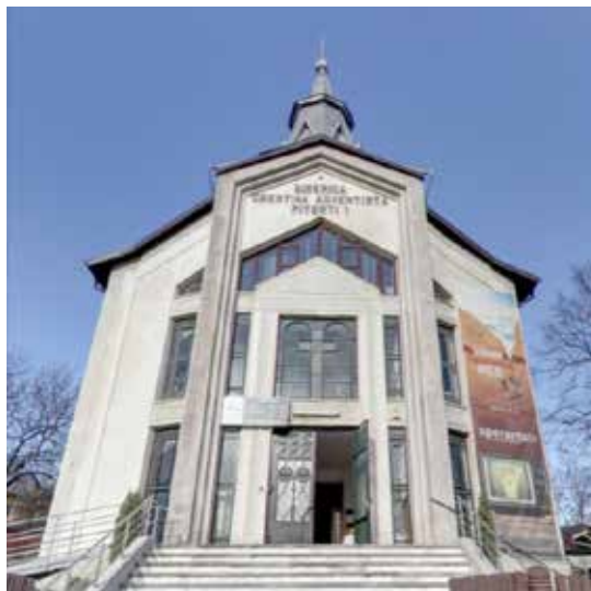
A Pitești-i adventista imaház. Virtuálisan beléphettek az imaházba, ha rákattintottak a következő címre: https://goo.gl/fjTtE9

Befejezésül, az Olténiai Egyházterület a Curie-rul Adventist és az Adventszemle minden olvasójának egészséget és Isten békéjét és örömét kívánja. Lelkészeink, presbiteraink – családjaikkal egyetemben –, gyermekeink, fiataljaink, alkalma-