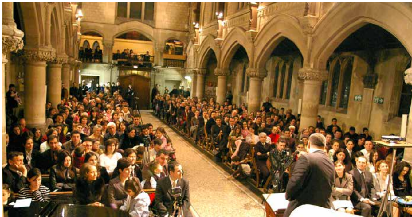
A Neuilly-sur-Seine-i román adventista gyülekezet 2005-ben.

LEGFRISSEBB GYÜ- LEKEZETÜNK, AMELY 2015-BEN KEZDTE MEG MŰKÖDÉSÉT EGY PÁRIZSI LUTHERÁNUS KÁPOLNÁBAN, NAGY FELADATOT TŰZÖTT KI MAGA SZÁMÁRA: EVANGELIZÁCIÓT VÉGEZNI A FRANCIÁK KÖRÉBEN, VALAMINT BEVONNI AZ ADVENT KÖZÖSSÉGBE A MÁSO- DIK FRANCIORSZÁGI ROMÁN NEMZEDÉKET.