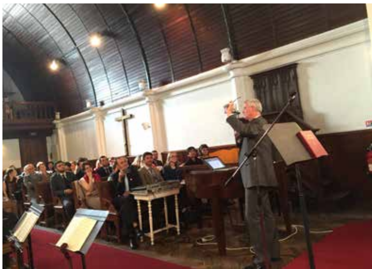
A Place d’Italie téren található új román gyülekezet.

OLYAN EMBEREK, AKIK ROMÁNIÁBAN, NORMÁLIS KÖRÜLMÉNYEK KÖZÖTT NEM LÉPTEK VOLNA BE EGY ADVENTISTA IMAHÁZBA, IDE ELJÖTTEK, HOGY ANYANYELVÜKÖN HALLGATHASSÁK ISTEN IGÉJÉT.