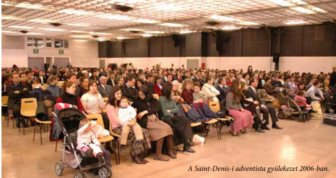
A Saint-Denis-i adventista gyülekezet 2006-ban.