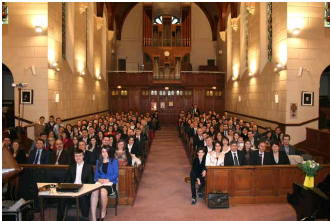
A „Maranatha” gyülekezet 2014-ben (Passy-Trocadero).

A ROMÁN ADVENTISTA KÖZÖSSÉGEKET HATÉKONY EVANGELIZÁCIÓS ESZKÖZÖKKÉ SZERETNÉNK TENNI A PÁRIZSI LAKOSSÁG KÖRÉBEN. EZ MEGKÖVETELI, HOGY KULTURÁLISAN ZÁRT KÖZÖSSÉGÜNKET FOKOZATOSAN MEGNYISSUK, ÉS OLYAN GYÜLEKEZETEKET ALAPÍTSUNK, AMELYEK VONZÓAK LEHETNEK A PÁRIZSI AGGLOMERÁCIÓBAN ÉLŐK SZÁMÁRA.