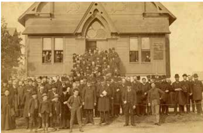
Minneapolis, 1888, a 27. Generál Konferencia