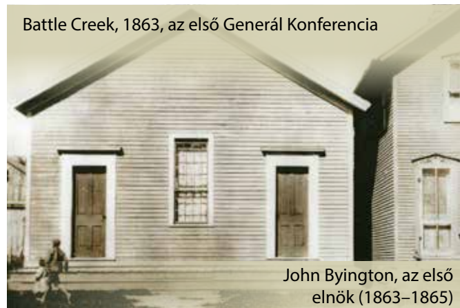
Battle Creek, 1863, az első Generál Konferencia

1863 után az Adventista Egyház folyamatosan növekedett. Míg 1863-ban 3 500 tag csoportosult 13 egyházterületbe, 1890-ben már 15 000 tagot számláltak 24 egyházterületben, mely közül az elsőt az USA területén kívül Dániában