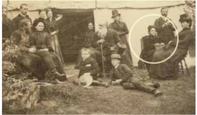
Az első európai tábort összejövetelt Norvégiában, Mossban szervezték, 1887-ben.

Az 1800-as évek két lényeges kötet kiadásával értek véget: Pátriárkák és próféták (1890) és Keresztény mértékletesség (1890). Ez utóbbi átfogó tanulmány az egészségről, A nagy Orvos lábnyomán (1905) előfutára. Annak ellenére, hogy az 1880-as év sok nehézséget hozott, Ellen White fáradhatatlanul folytatta tevékenységét. Férje elvesztésének fájdalma, a különböző gyülekezeti gondok, a külföldi missziós utak nagymértékben hozzájárultak tapasztalatának gazdagodásához. Most készen állt új kihívások fogadására, amint a növekvő adventista felekezet a századfordulóhoz közeledett. Mindezek előtt azonban egy új missziós útra indult, Ausztráliába. ■