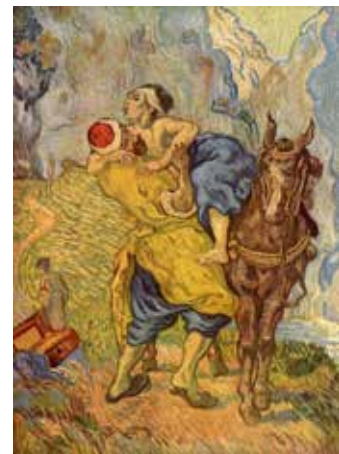
„Az irgalmas samaritánus”, Vincent van Gogh 1890-ben készített festménye, mely ma a Kröller-Müller Múzeumban látható.

Van Gogh megértette, hogy az embernek nemcsak prédikációra, hanem egy kinyújtott kézre is szüksége van. A szó és a tett egymással kéz a kézben kell haladjon. Vajon hányan gondolkodunk ma hasonlóképpen? Semmi nem kell átvegye a szenvedélyes odaadás helyét. Bármi legyen is ennek a gondolatnak az ára, azt meg kell fizetni. Mi lehet szebb annál, mint ha alázatos, de mégis lelkileg lelkes tanítványok maradunk? Ne engedjük meg, hogy a teológiai, társadalmi, kulturális, politikai nehézségek vagy a vallási véleménykülönbségek elvonják figyelmünket Isten, Jézus Krisztusban kinyilatkoztatott szeretetének terjesztésétől és Isten Törvényének tekintélyétől, amely a lét alapja. A jelenkori misszióknak szüksége van a Szentírásba és Jézus példájába horgonyozni. Szenvédélyesen odaadó gyülekezetekre van szükség, melyek hordozzák a teljes Evangéliumot és elviszik azt az egész világra. ■