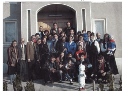
A slăvești-i gyülekezet, 2001

Jelenleg 70-re csökkent tagjaink létszáma, mivel egyesek külföldön vállaltak munkát, míg többen más gyülekezetekbe kérték a tagságukat, de reméljük, hogy az Úr az Ő népe felé fordítja arcát és mindannyian csatlakozunk az Ő munkájához. ■