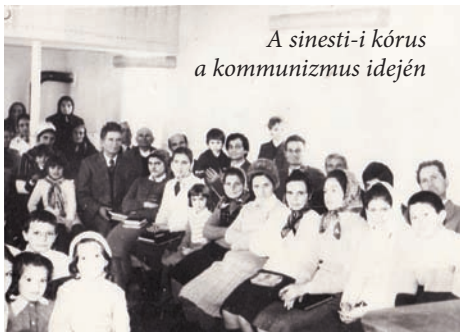
A sinești-i kórus a kommunizmus idején