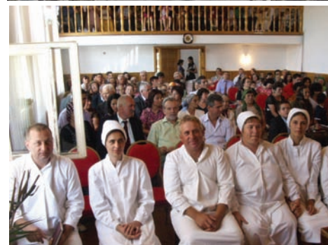
Kereszttség a slăvești-i gyülekezetben