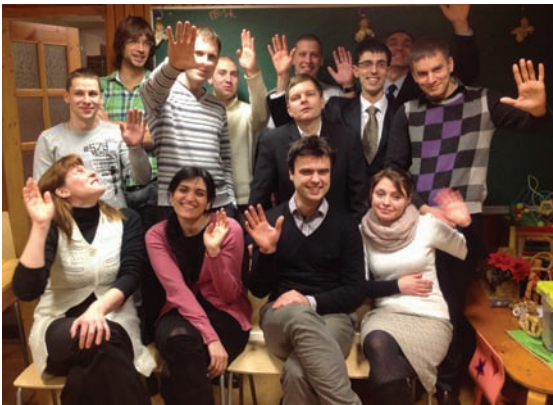
Vlad orosz fiatalok körében

Jelenleg 20 észt nemzetiségű adventista gyülekezet működik az országban, 1600 taggal, és 3 orosz nyelvű gyülekezet, összesen körülbelül 280-as taglétszámmal. Ezek mellett 6 csoport is tevékenykedik.