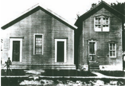
A Generál Konferencia 1863. május 21-i ülése, ahol az akkor létező 7 konferencia közül 6-ból mintegy 20 küldött volt jelen.