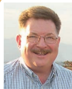
Bill Knott, az Adventist Review és az Adventist World főszerkesztője