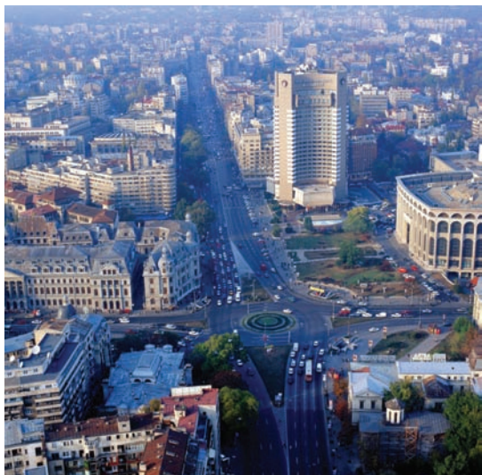
Piața Universității, Bukarest

Munténiai Egyházterület – Az idei évtől Bukarestben a „Misszió a nagyvárosokban” program keretében több missziós tervet ültetünk gyakorlatba. A 2011-es népszámlálás adatai szerint a fővárosnak 1 600 000 lakosa van, ebből 4700 adventista.