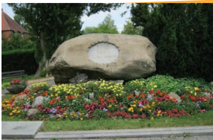
Ez az emlékmű jelzi a helyet, ahol 1415. július 6-án Husz Jánost máglyán megégették.

Mivel a helyszín a reformáció jelentős nyomait hordozza, az ASI Európa találkozó szervezői úgy gondolták, hogy éppen találó, ha az idei esemény mottója magában foglalja a keresztény misszió mozgatórugóját: