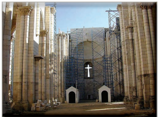
Most épülő ortodox templom; az alagsorban, az oltár alatt található Jákób kútja.