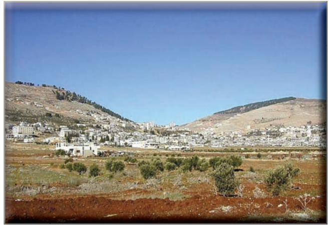
Ebál és Garizim iker-hegyei, melyek lábainál található a Mórétölgyese, Sikem mellett.

A pátriárkák hátat fordítottak a korabeli civilizált világnak. Nemet mondtak egyfajta életstílusnak, bizonyos túlélési módszereknek, és lemondtak a civilizáció nyújtotta előnyökről. Visszautasították kortarsaik hagyományait, szokásait és életvitelét. A pátriárkák egy új világot, új civilizációt hoztak létre. Központjuk az oltár volt, határmezsgyéjük a hit. Előre tekintettek „az erős alapokon nyugvó városra, melynek tervezője és építője Isten”. Nem voltak