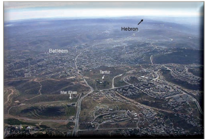
Légifelvétel Júdea hegyeiről, melyen a Pátriárkák Útja is látszik.

Amikor Józsué elfoglalta Kánaánt, a zsidók a hegyekben telepedtek le, a Pátriárkák útja pedig az ország központja lett. Az ókori világ egyetlen civilizációja volt, amely az akkori szokással ellentétben nem folyóvíz mentén telepedett le. Biztonságukat nem a folyók és az öntözés jelentette, hanem Isten áldása, aki esőt és harmatot ren-