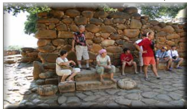
Dán 2. kapuja, a királyi trón és az öregek padja