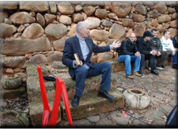
Dán 2. kapuja, a királyi trón és az öregek padja

„Erre kivonultak az Izráel minden fiai és összegyülekezett a nép, mint egy ember, Dántól fogva Bersebáig...” (Bír 20:1)