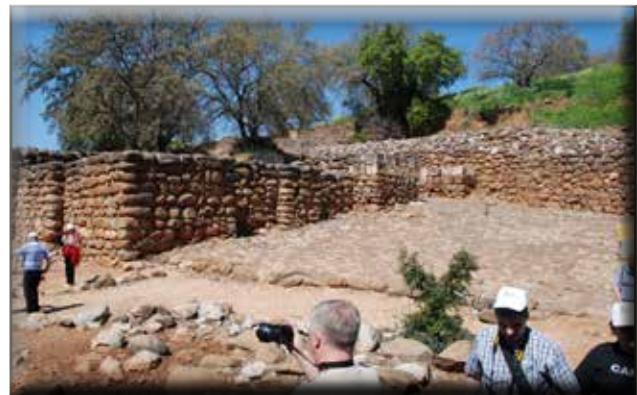
Tel Dan: 1. kapu a „szekérparkolóval”, és izraelita városfalak

Izrael északi királyságának megalakulása után Jeroboám Dán városát választotta vallási központjának kiépítésére. Ez egy nagy oltárból és egy szabadtéri magaslatból állt. Ehhez hasonló központ Bételben is létezett, a királyság legdélebbre fekvő településén.