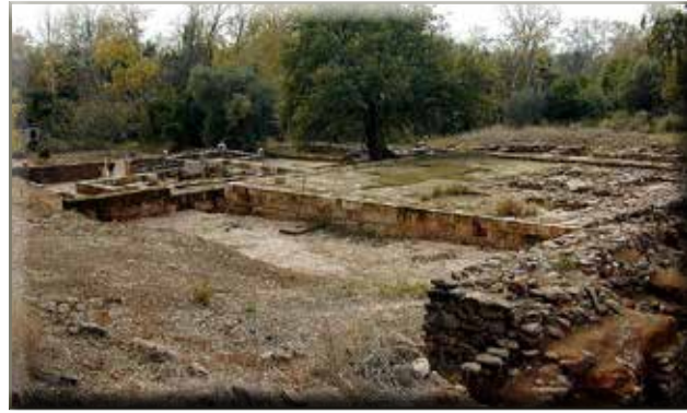
Tel Dan – a szent hely, a magaslat és az oltár

A Baása király idejében zajlott szíriai hadjárat egyetlen győzelmi sztélét (emlékmű) hagyott maga után. Ebből egy töredéket találtak meg, a következő felirattal: „... Izrael királyai... Dávid háza...”. Ez a legkorábbi olyan régészeti adat, amely Dávid királyról beszél és ennek a királyi háznak a hírnevét bizonyítja. Az idegenek számára Izrael királyai Dávid leszármazottai voltak.