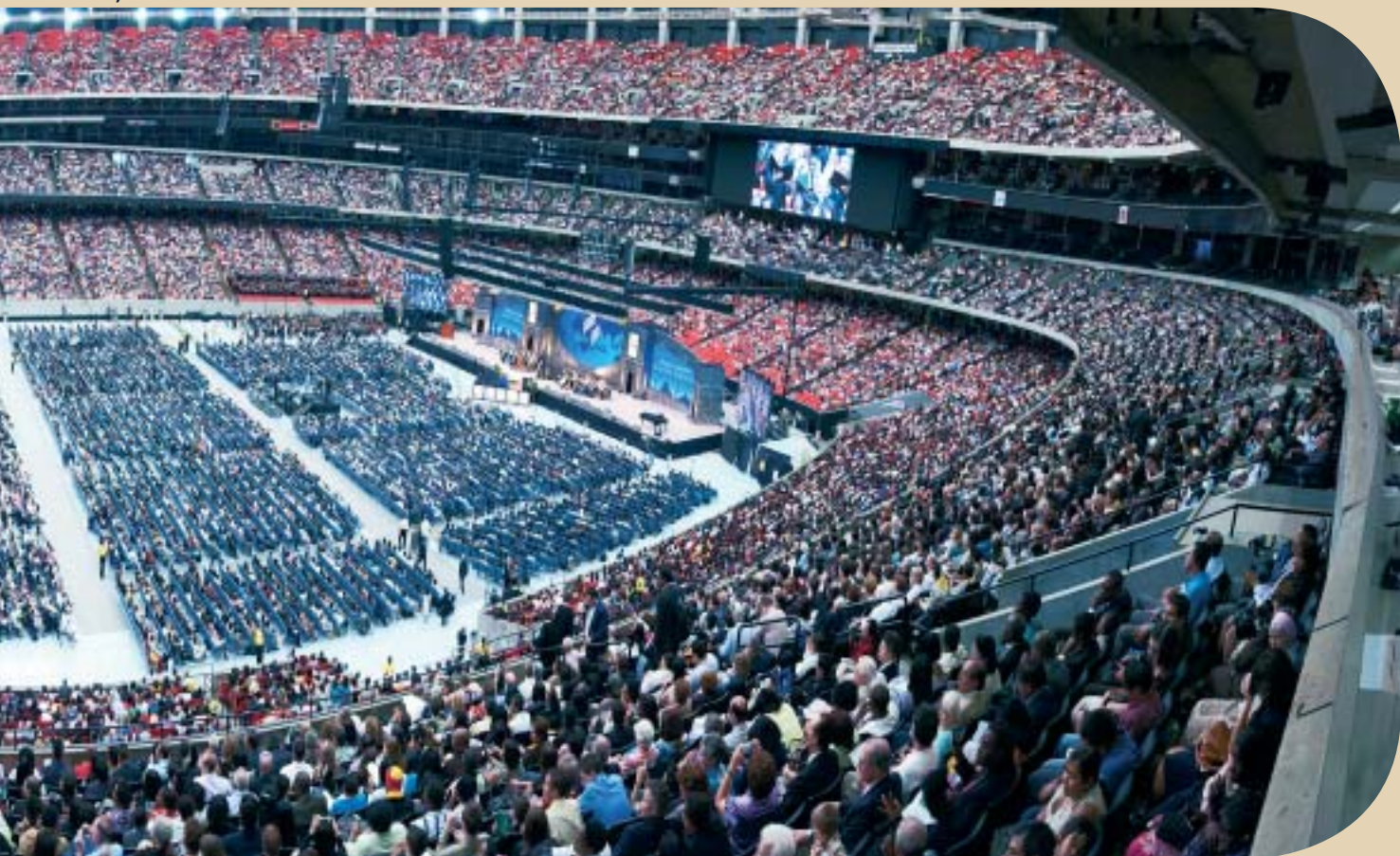
július 3-a, szombat