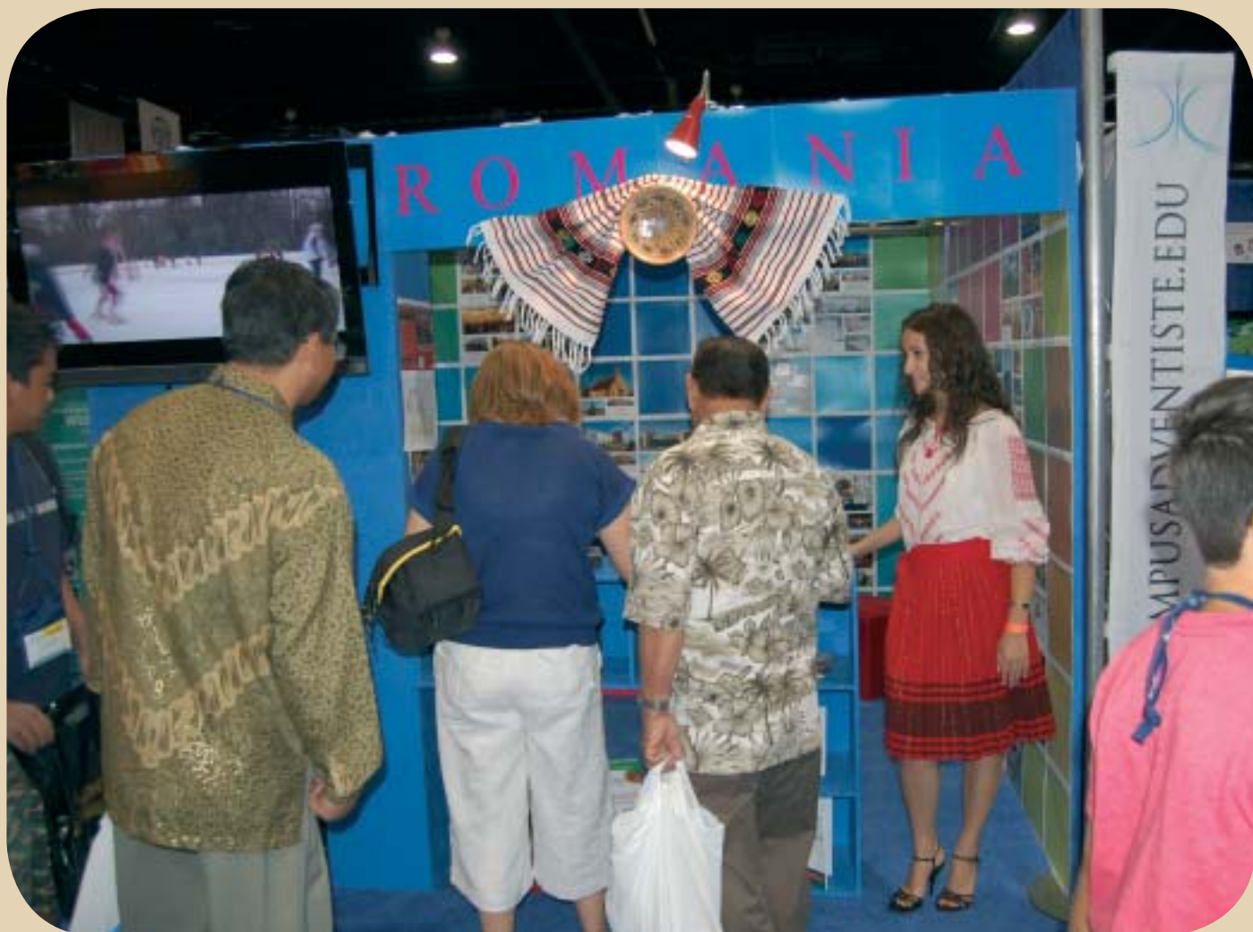
A román stand az atlantai GK-án