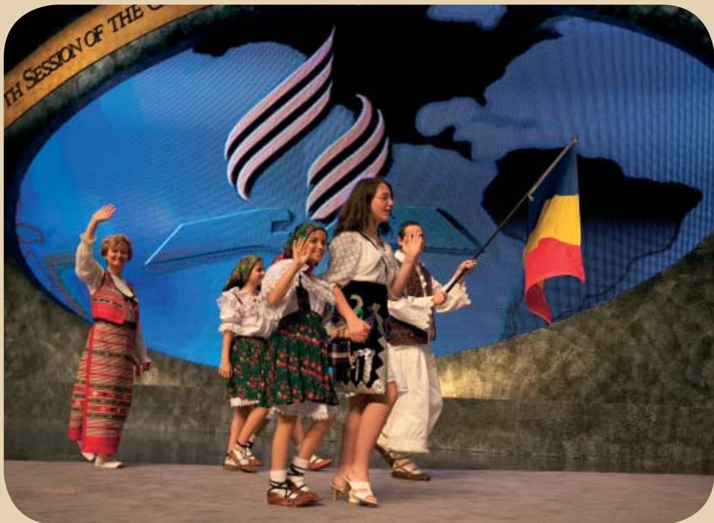
A nemzetek felvonulása