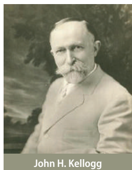
John H. Kellogg

Întrucât carta sanatoriului expira în 1897, Kellogg a făcut o manevră legală, care să-l avantajeze. Doctorul a fondat o nouă instituție, a transferat acestei instituții sanatoriul, iar membrilor noului bord, care erau de asemenea adventiști, li s-a cerut să semneze că sanatoriul va fi un stabiliment „pur umanitar și filantropic, nedenuminațional și nesectar”. Astfel, doctorul se asigura că sanatoriul (care fusese proiectul bisericii!) nu va ajunge sub controlul liderilor adventiști. 1