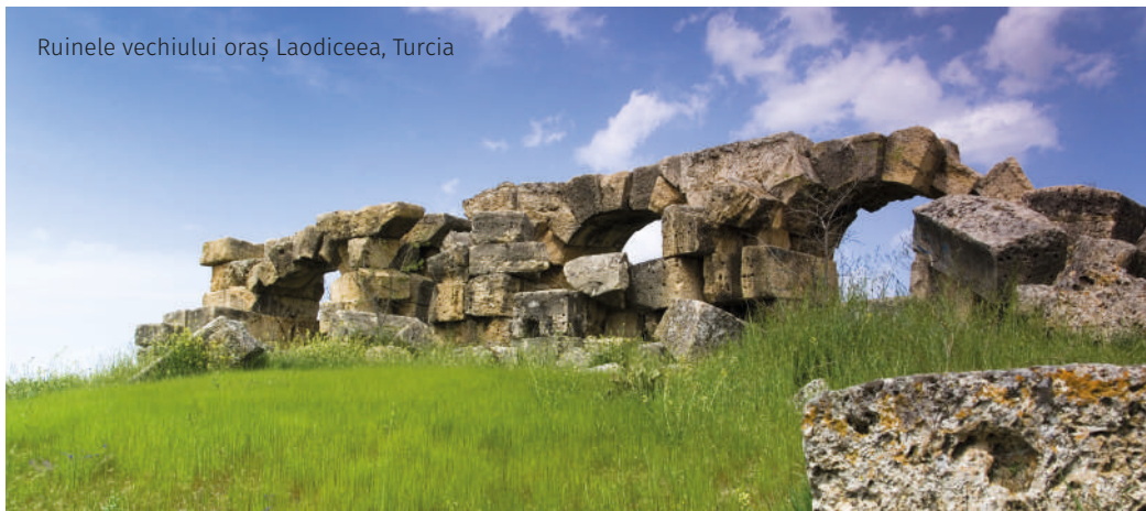
Ruinele vechiului oraș Laodiceea, Turcia

E ÎNGROZITOR SĂ-ȚI LIPSEASCĂ CEVA VITAL ȘI SĂ NU ȘTII CĂ-ȚI LIPSEȘTE, SAU SĂ AFLI PREA TÂRZIU.