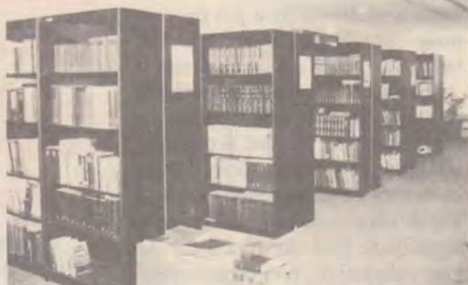
Biblioteca - la cota cea mai înaltă