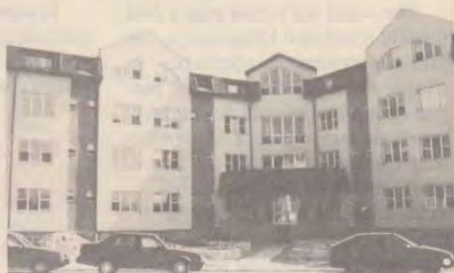
Căminul - plin aproape tot timpul