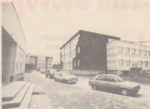
Orășelul studentesc capătă contur.

În curând vă voi da un nou raport. Aparatul de fotografiat va immortaliza, cu siguranță, și partea de investiție care vă reprezintă.