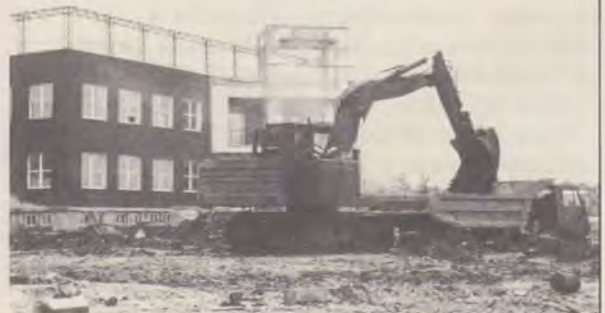
La Cernica, șantierul se grăbește.