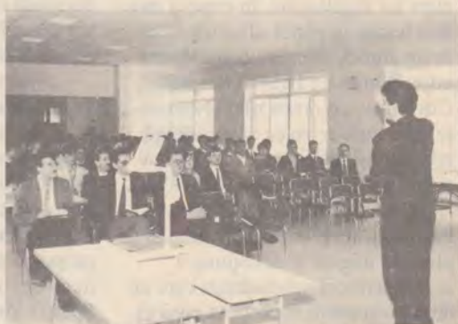
Cantina - acum și capelă