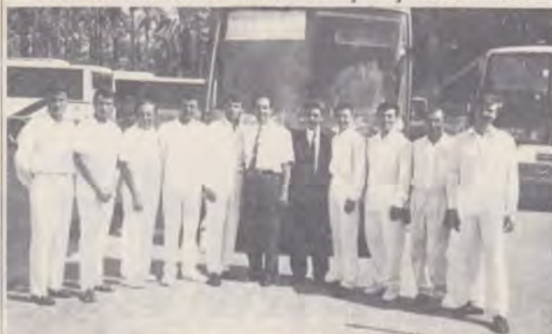
Nouă persoane au fost botezate în Iordan la 12 octombrie 1996. În cadrul programului Net '96