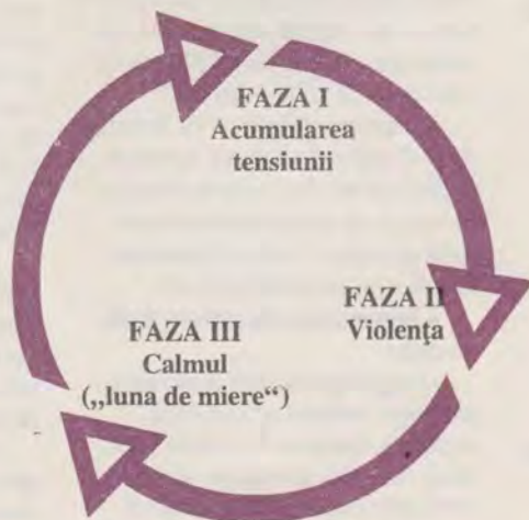
Figura 1: Ciclul violenței

Neintervenția este o cale prin care scuzăm