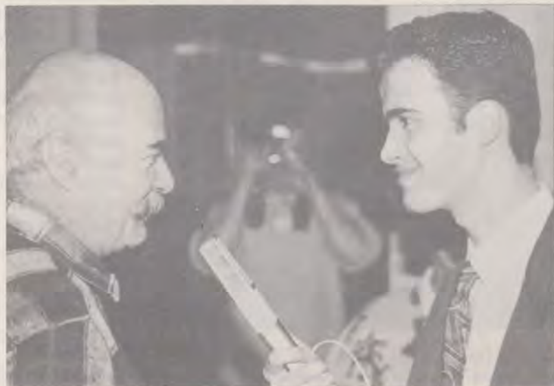
Dl. Tudor Gheorghe interviuat de Mihai Gădea, redactor la RVS

I.S.: Absolut necesar. Mă bucur că găsesc aici oamenii puternici sufletește ai Bucureștiului. În contextul în care atâtea posturi de radio plutesc în derizoriu, bătând tobele, programul vostru cultural este onorant pentru conștiința noastră și mă bucur că existați! Vă doresc succes să vă impuneți în lumea asta!