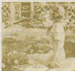
12 Sănătatea ca misiune