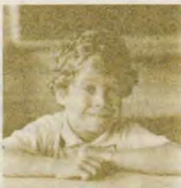
23 Colțul copiilor

plarul trimis va fi reținut la redacție pentru o posibilă publicare. Articolele se vor scrie la două rânduri și nu vor depăși trei coli format A4. Ele vor fi însoțite de numele autorului, adresa și telefonul. Nu publicăm articole nesemnate.