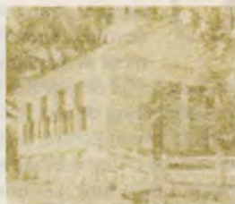
9 Ce înseamnă a fi rămășiță

De asemenea, primim cu plăcere manuscrise nesolicitate. Sunt binevenite informații și inițiative din viața comunităților. Aprecieri articole care tratează aspecte legate de experiența personală, puncte de vedere asupra problemelor majore care ne confruntă, articole pentru copii. Vă rugăm să păstrați o copie, deoarece exem-