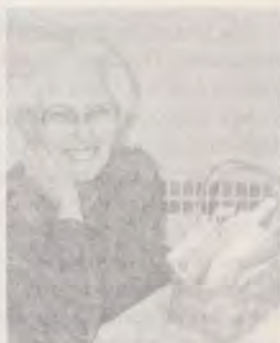
5 Gândurile cerului