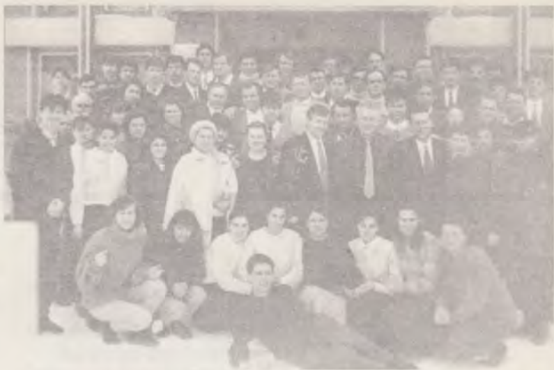
13-22 Iebruarie 1990, Vatra Doinei. Prima promoție a Școlii misionare pentru colportori a Conferinței Muntenia.

2. Echipament. Peste 95% din colportori sunt tineri și tinere, veniți la adevăr în ultimii ani, unii de pe băncile liceului, fără posibilități materiale. Datorită