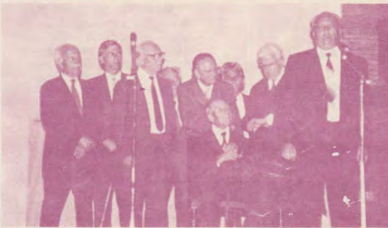
Glasurele veteranilor - puțini câți au mai rămas printre noi - aduc mărturia celor care au rezistat sub două dictaturi. O mărturie care nu trebuie uitată.

Se rostesc legăminte solemne. Se fac apeluri fierbinți, vaiuri și fericiri tălăzuiesc spre publicul încins. Proza și poezia, oratoria și muzica, sunele și imaginea trag frățește la același jug. Varietatea textului e impresionantă, interpretarea cuceritoare, ilustrația muzicală, de-a dreptul celestă.