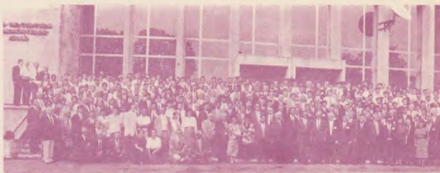
Delegații la Adunarea Generală a Uniunii, la încheierea lucrărilor. Probabil nu se pot distinge fețele, ceea ce se va remarca va fi unitatea, consacrarea și iubirea.

prezentate de remarcabili profesori adventiști cu privire la aspecte distincte ale credinței noastre. Și, iată, legătura noastră a devenit destul de strânsă, ceea ce ne-a oferit ocazia să cunoaștem și alte persoane de mare valoare care participă la aceste întâlniri. Biserica adventistă a putut astfel să fie cunoscută între profesori de universitate, diplomați și alte persoane cu poziții înalte în societatea spaniolă.