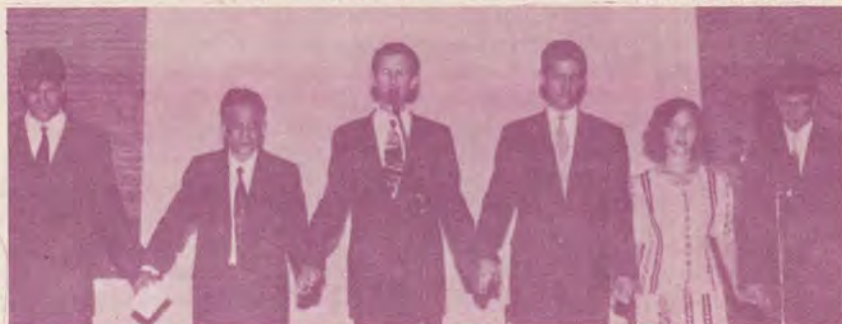
Sabatul de neuitat din 5 august 1995 s-a încheiat cu acest lanț uman al rugăciunii, semn al consacării, al unirii dintre generații și al angajamentului pentru spiritualitate și misiune.

Am încercat să facem cunoscută biserică noastră transmițând tot ceea ce este mai bun în mesajul nostru. Noi am format diferite organi-