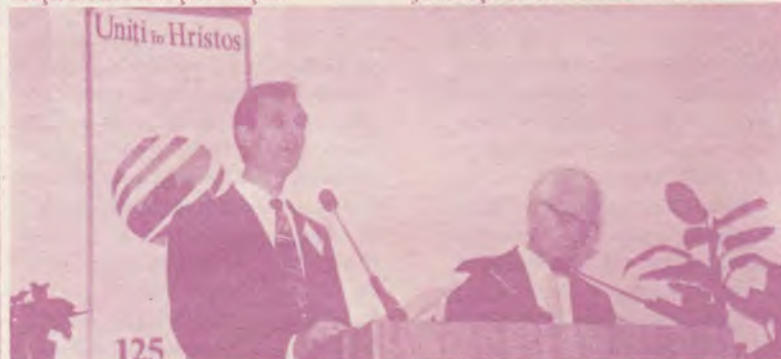
Arad, 3 august, ora 9.00. Deschiderea oficială a Adunării Generale, sub emblema Uniții în Hristos. Istoria adventă din România numără deja 125 de ani.

Spre seară, ne-am risipit în diferite direcții, mulți dintre noi fiind invitați în comunitățile locale sau învecinate. Astfel, am adăugat un plus de bucurie la aceea de a ne revedea cu mulți dintre iubii noștri frați la Arad. O armată de lucrători și pastori, de laici proeminenți și de slujitoare ale altarului familial ne-am risipit ca să începem un Sabat de odihnă sărbătorească și, respirând această atmosferă înviorătoare, să ne întoarcem în comunitățile noastre, înapoi... pe pământ, unde dorim să fie precum în cer!