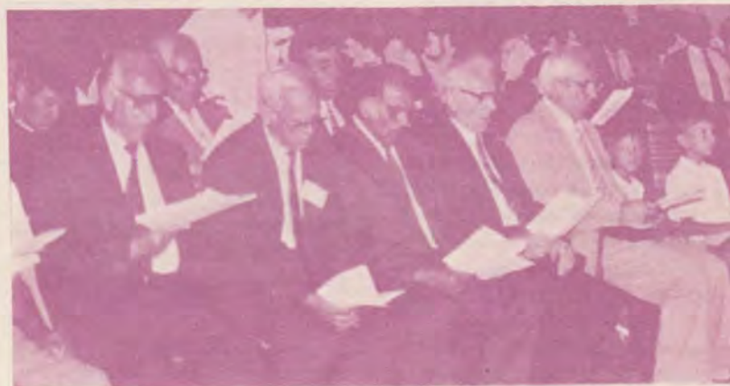
Arad, 5 august. Pastori activi și veterani, un preot ortodox, un pastor baptist, dl. ministru al cultelor și câțiva copii cântă împreună! Atâta dor s-a strâns în pieptul nostru slab.