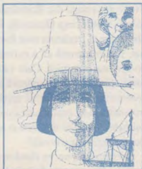
9 Evanghelia veșnică unește pe toți oamenii

„Dumnezeu va da tot mai multă lumină, iar vechile adevăruri vor fi redescoperite și așezate în rama prețioasă a adevărului. Ca ambasadorii ai lui Hristos, noi trebuie să cercetăm Scripturile și să căutăm adevărurile care au fost ascunse sub gunoii erorilor, iar fiecare rază de lumină primită trebuie să fie comunicată altora. Un interes va predomină, un subiect va înghiți pe toate celelalte; Domnul Hristos, Neprihănirea noastră.”