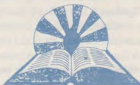
14 Cartea - drum spre Isus

Articole și interviuri dedicate Anului femeii adventiste