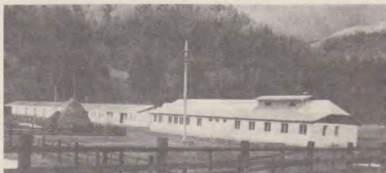
Centrul de tineret RUCĂR, jud. Argeș

Unul dintre riscurile primului val de entuziasm a fost acela al acțiunilor