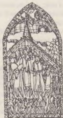
6 Urmașii reformatorilor