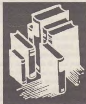
20 Recenzii de carte

Publicația oficială a Bisericii Creștine Adventiste de Ziua a Șaptea din România.