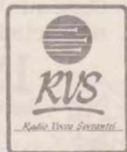
16 Vocea speranței raportează