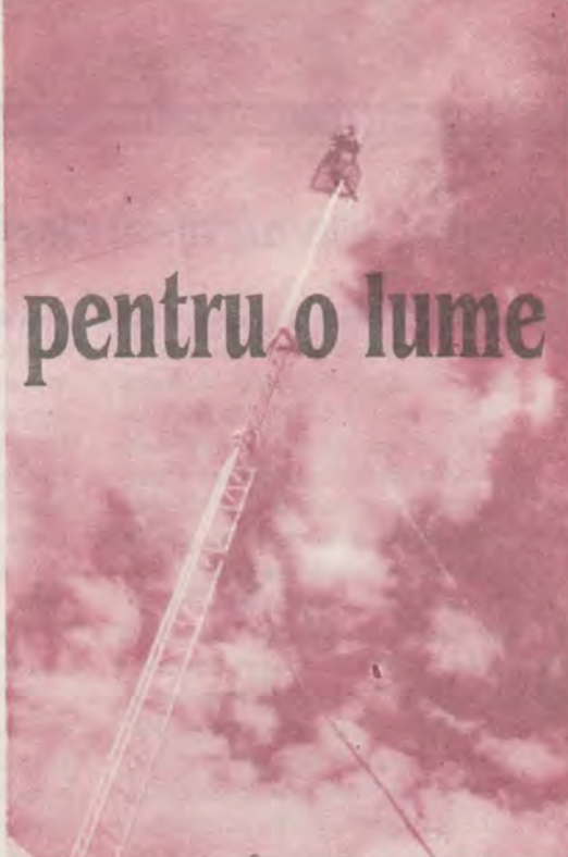
Antena din București

Răzvan N. (tânăr) - București: „Legăturile mele cu religia erau rupte din copilărie... a fost o adevărată sur-