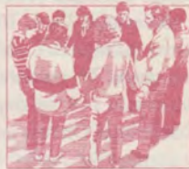
22 Religia este esențială pentru familie

trimis va fi reținut la redacție pentru o posibilă publicare. Articolele se vor scrie la două rânduri și nu vor depăși trei coli format A4. Ele vor fi însoțite de numele autorului, adresa și telefonul. Nu publicăm articole nesemnate.