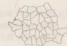
5 Masă rotundă

De asemenea, primim cu plăcere manuscrise nesolicitate. Sunt binevenite informații și inițiative din viața comunităților. Apreciam articolele care tratează aspecte legate de experiența personală, puncte de vedere asupra problemelor majore care ne confruntă, articole pentru copii. Vă rugăm să păstrați o copie, deoarece exemplarul