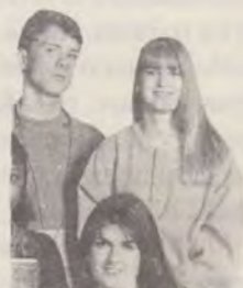
12 Ideal biblic pentru tineretul lui '94

Publicația oficială a Bisericii Creștine Adventiste de Ziua a Șaptea din România. Apare lunar, sub coordonarea Comitetului Uniunii