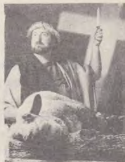
4 Străpuns pentru păcatele noastre