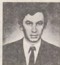
Pastor, Aldea Traian