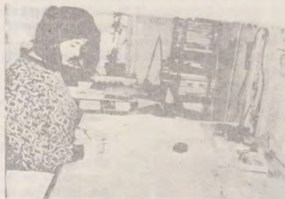
LA MASA DE MONTAJ