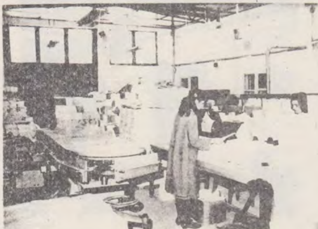
MAȘINI DE BROȘAT