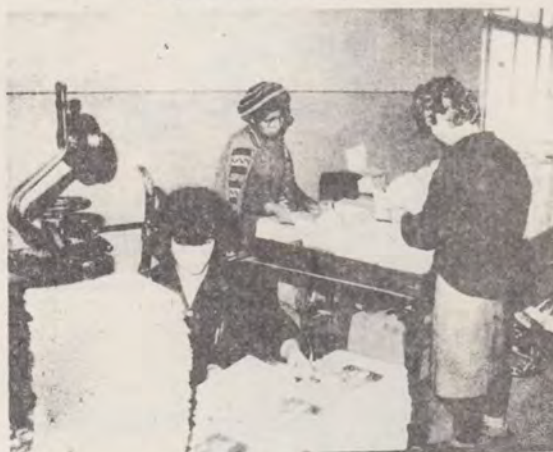
LEGĂTORIE - SORTAT ȘI ADUNAT