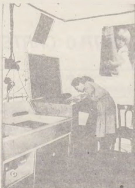
LA LABORATORUL FOTO