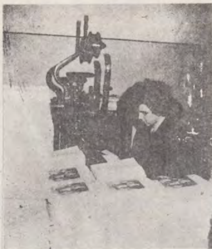
MAȘINA DE CUSUT

va însoți lucrarea pe tot parcursul fazelor de producție.