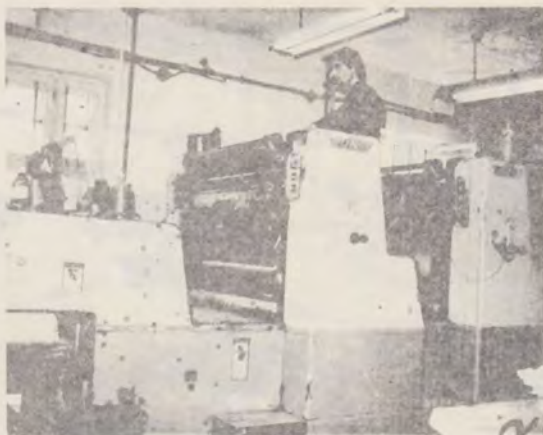
MAȘINA DE IMPRIMAT (OFSET) - MARCA MILLER

Materialul astfel pregătit și redactat ajunge la secția comenzi. Aici se face fișa tehnică, se face un antecalcul și se deschide punga de comandă, care