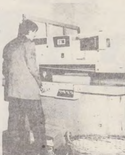
MAȘINA DE TĂIAT