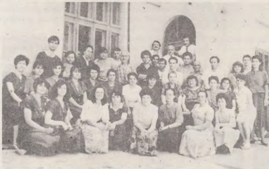
PERSONALUL EDITURII ȘI TIPOGRAFIEI „CUVÂNTUL EVANGHELIEI” - 1993

La începutul activității ei, lucrurile au mers mai timid, mai fără experiență. Învățând din