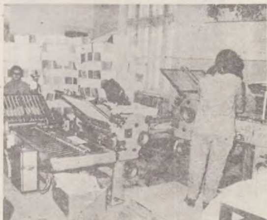
MAȘINA DE FĂLȚUIT