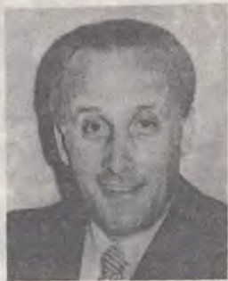
E. LUDESHER PREȘEDINTELE DIVIZIUNII EURO-AFRICA