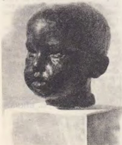
C. Brîncuși: Cap de copil

I n satul Bogonos din județul Iași nu avem nici un membru, așa că în ziua de 20 aprilie, am localizat pe hartă acest punct și cu rugăciune am plecat la drum.