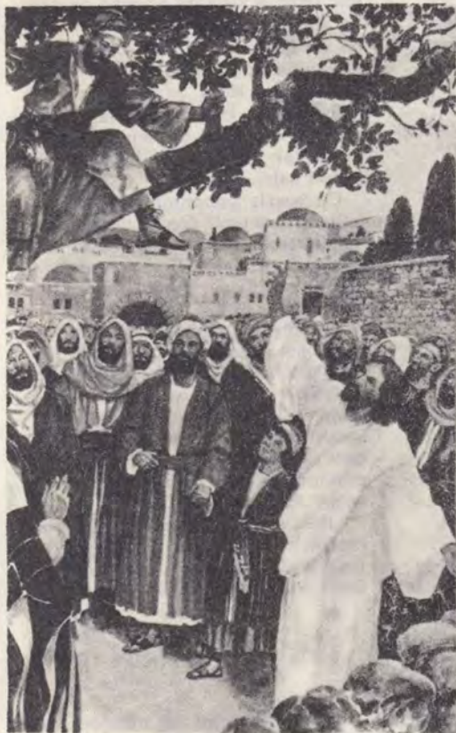
Pentru cei mici