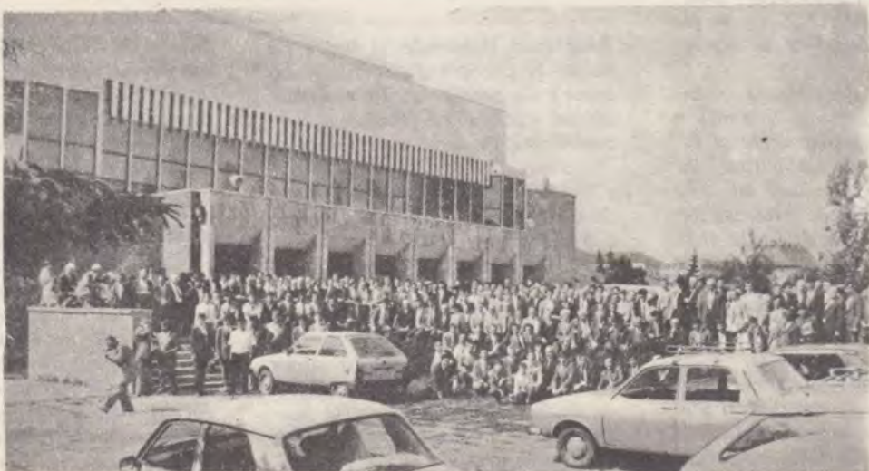
Participanții la întrînire în fața sălii Polivalente din Tîrgu Mureș.