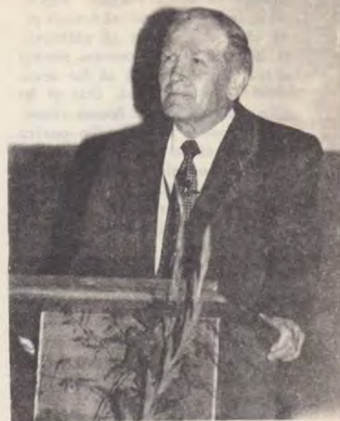
Fl. Bresee Director General Asociația Pastorală-Conferința Generală

„Da, dar nu ne putem permite acum s-o cumpărăm“ spuse soțul.