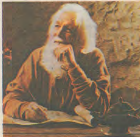
El a văzut trei îngeri fiecare cu o solie de la Dumnezeu, transmițînd apelul Său final oamenilor.

înainte ca Domnul Hristos să revină, credinciosul Său popor va face apel la fiecare persoană de pe pământ ca mai degrabă să onoreze, să dea slavă lui Dumnezeu printr-o credincioasă ascultare de poruncile Sale, decît să slujească «fiarei» puterea care se opune lui Dumnezeu. Este deci o chemare la luarea unei decizii,