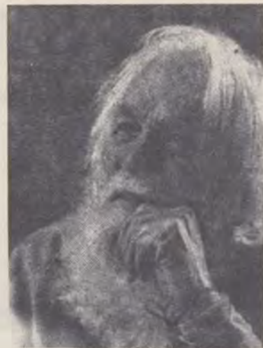
IOAN - VIZIONARUL

Moartea Domnului Hristos a fost un triumf, deși omeneste vorbind părea o înfrîngere. Tot așa stau lucrurile și cu fiecare creștin. Moartea lor a fost o biruință. Dar ei au fost și au rămas credincioși pînă la moarte. Despre Jane Welsh, soția lui John Knox, se spune că într-o zi unele persoane cu autoritate i-au spus că dacă ea va folosi influența ei pentru a determina pe soțul ei, ce era închis pentru credință, să renunțe la convingerile sale religioase, atunci viața lui