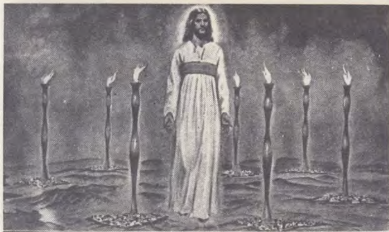
Isus prezent în Biserica Sa din toate timpurile