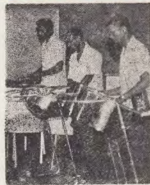
Muzica „Tobelor de oțel” al tinerilor din Trinidad și Tobago a încântat asistența.

Sabatul este centrul adorării lui Dumnezeu. El ne determină să cunoaștem pe Dumnezeu, să credem și să ne încredem în el.