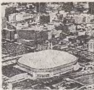
INDIANAPOLIS 1 — 14 IULIE 1990