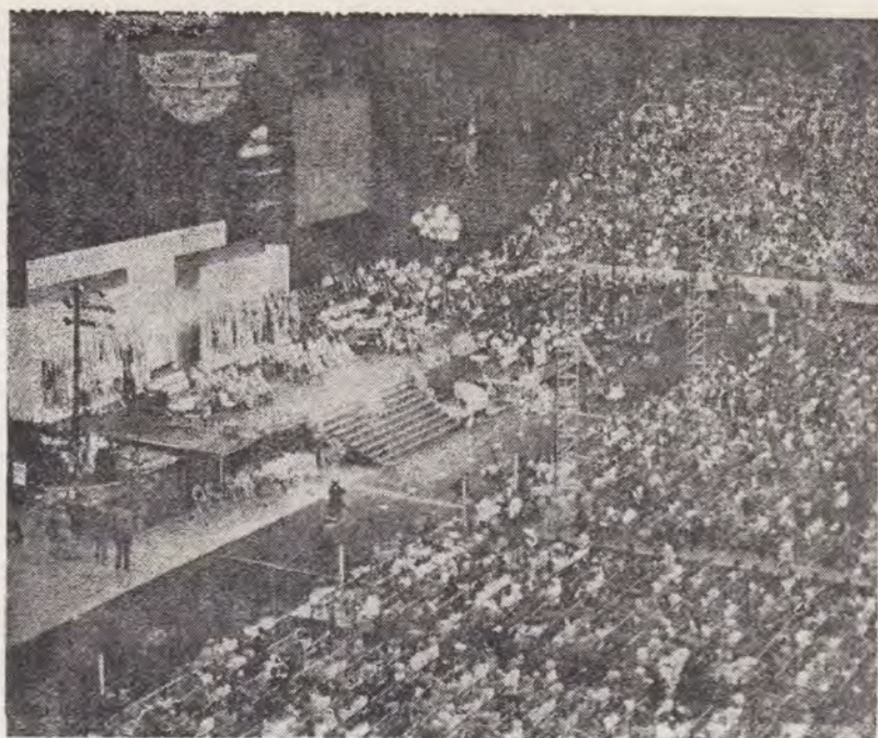
Aspect din timpul lucrărilor celei de a 55-a sesiune a Conferinței Generale