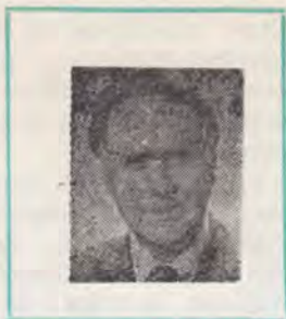
Jan Paulsen Președinte

C înd acum cinci ani am prezentat raportul diviziunii noastre, eram o diviziune al cărui teritoriu fusese amputat și numărul de membri diminuat, atunci cînd a luat ființă Diviziunea Africa-Oceanul Indian. De fapt, ce ne-a mai rămas era în Europa. A fost ceva traumatizant, mai ales că de zeci de ani diviziunea lucra în colaborare cu mai multe țări din Africa. De aceea, perioada 1980—1985 a fost neobișnuită pentru noi.