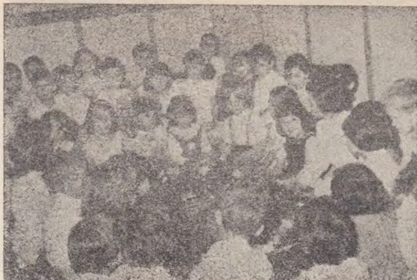
Școala de Sabat copii