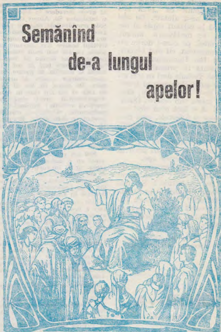
„Fericite de voi, care semănați pretutindeni de-a lungul apelor“ (Is. 32,20).

Primul trimestru al anului ce încununează deceniul, ne-a confruntat cu mulțimea fronturilor deschise de-a lungul atîtor ape. Nevoi organizatorice și de „aprovizionare“ se cereau rezolvate în chiar timpul semănătorului. Experiența se cerea acumulată și valorificată în timp record, dar toți coi ce înaintează pe genunchi izbutesc.