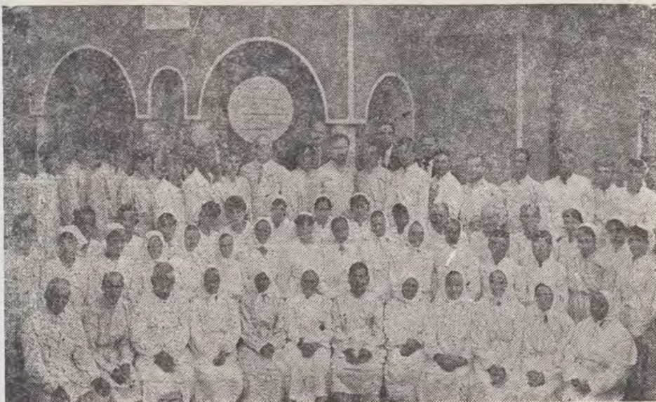
Botez în comunitatea Plosca județul Teleorman.

Să rugăm pe Domnul, Dumnezeul nostru, ca fiecare dintre noi, avînd bine fixate privirile asupra binecuvîntărilor Sale din trecut, să se bizuie pe dragostea Sa binevoitoare și în zilele următoare, ca astfel alergarea vieții noastre să fie o binecuvîntare pentru semenii noștri și o pricină de slavă pentru Dumnezeul pe care-L slujim.