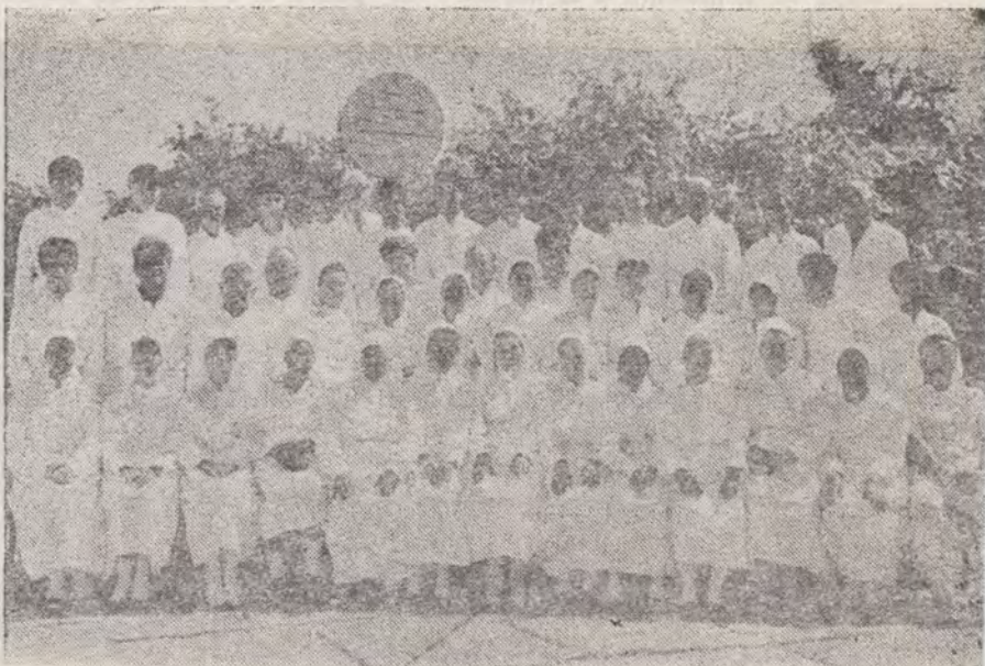
Botez în comunitatea Roșiori, județul Teleorman.

„Isus Se bucura pentru faptul că putea și încă poate face mai mult pentru urmașii Săi decât le-a promis. Era fericit că de la El avea să se reverse o iubire și compasiune care va curăți templul sufletelor și va transforma caracterul lor după asemănarea Sa; era fericit că adevărul Său va birui în final prin puterea Duhului Său” (P.A. 18—26).