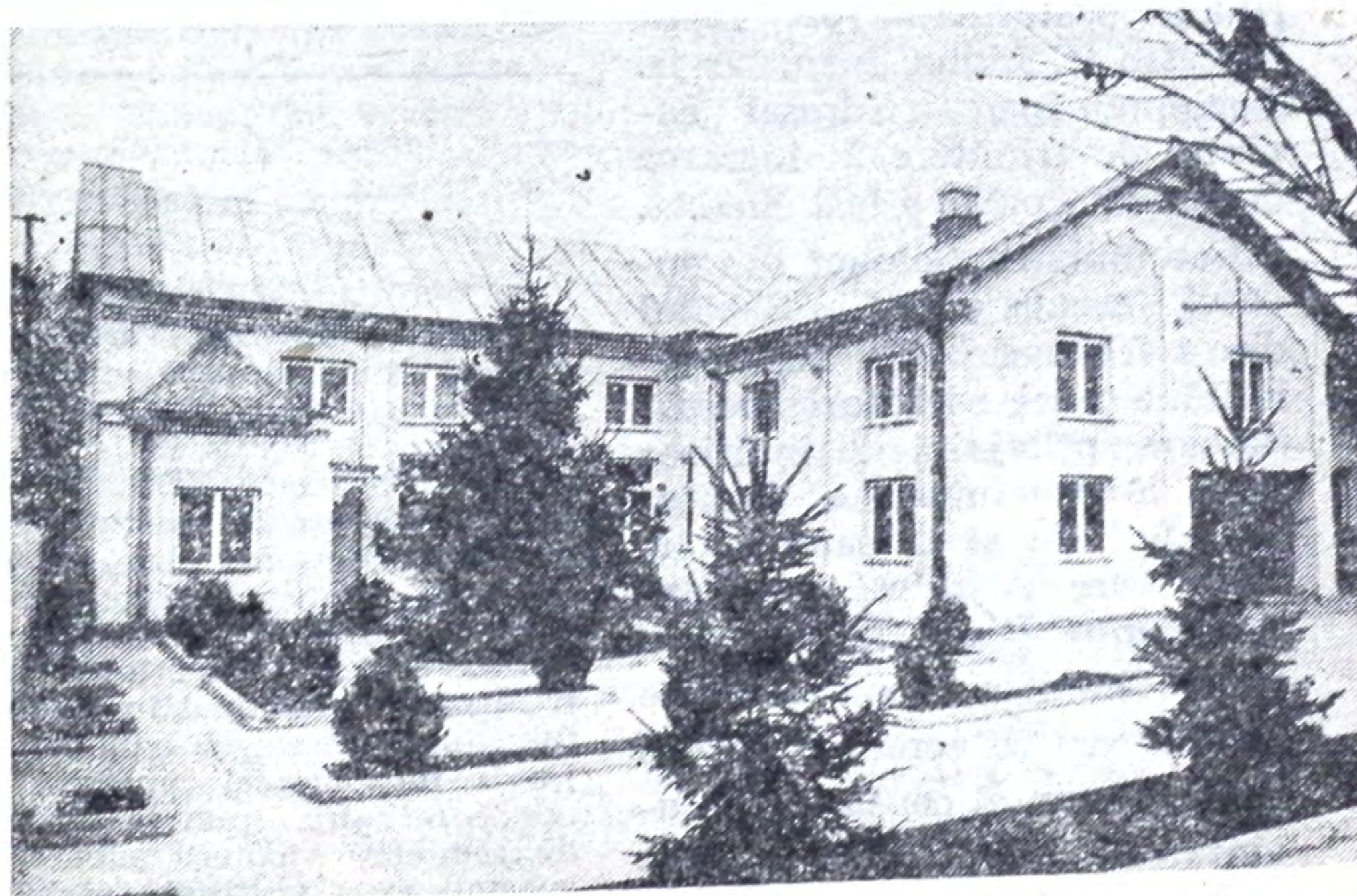
CASA DE RUGĂCIUNE A COMUNITĂȚII CURTIȘOARA JUD. OLT