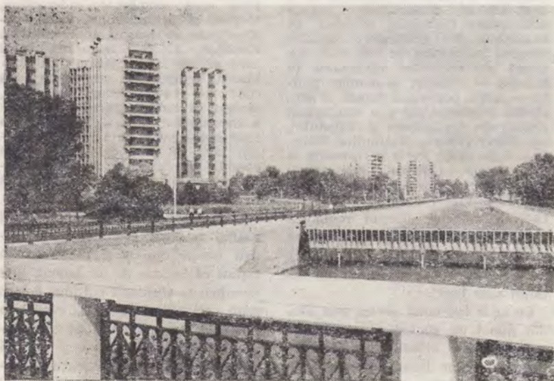
ASPECTE NOI DIN VECHIUL BUCUREȘTI

Lucrătorii Trustului antrepriză generală de construcții-montaj Mureș — unitate care, în cincinalul precedent, a înălțat și dat în folosință în orașele și satele județului nu mai puțin de 15 000 apartamente — raportează un nou fapt de muncă. Datorită organizării judiciase a muncii pe fiecare șantier, utilizării pe scară largă a unor materiale de construcții locale și folosirii raționale a energiei și combustibilului, ei au ridicat la 400 numărul apartamentelor construite și date în folosință în acest an. În prezent, se depun eforturi susținute pentru finalizarea înainte de termen a altor 1500 de apartamente, majoritatea fiind în stadii avansate de execuție.