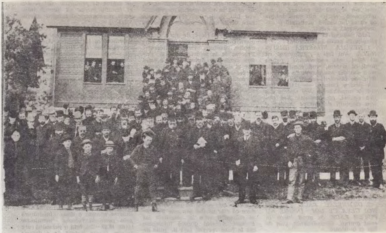
DELEGAȚII LA SESIUNEA CONFERINȚEI GENERALE DIN 1888