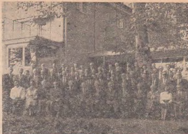
Între 8 și 17 noiembrie 1988 au avut loc la Jogy, lucrările comitetului executiv al organizației adventiste Diviziunea Euro-Africa.

3) Dezvoltă propria ta viață lăuntrică. Împletirea vieții celor doi de-a lungul vieții de căsătorie nu trebuie să ducă la sărăcirea personalității fiecăruia și nici la încetinirea dezvoltării autonome către idealurile așezate de Dumnezeu înaintea fiecărui individ. „În unirea voastră pentru viața întreagă, în iubire fiecare trebuie să slujească fericirii celuilalt. Aceasta este voința lui Dumnezeu pentru voi. Totuși, în timp ce vă împlețiți viețile ca una singură, nici unul dintre voi nu trebuie să-și piardă individualitatea în celălalt. Dumnezeu este posesorul individualității fiecăruia. Pe El trebuie să-L întrebați : Ce este bine ? Ce este rău ? Cum pot să îndeplinesc cel mai bine scopul pentru care am fost creat ?“ (AH 103).