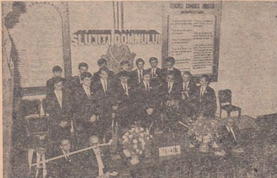
ASPECT DIN TIMPUL FESTIVITĂȚII DE ABSOLVIRE PROMOȚIA 1988

Sabatul s-a încheiat într-o atmosferă de înălțare sufletească și ho-