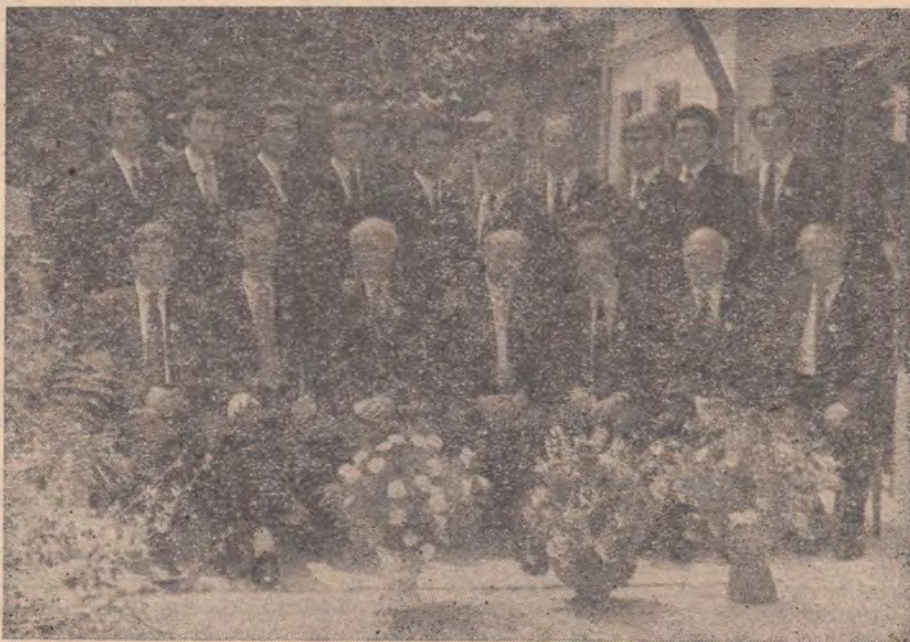
ABSOLVENȚII SEMINARULUI TEOLOGIC A.Z.S. PROMOȚIA 1988 ȘI CORPUL PROFESORAL