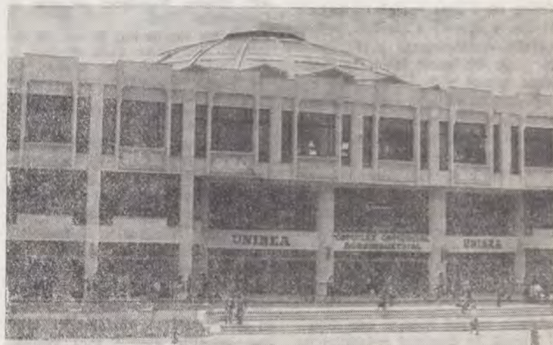
„Complexul Unirea București"