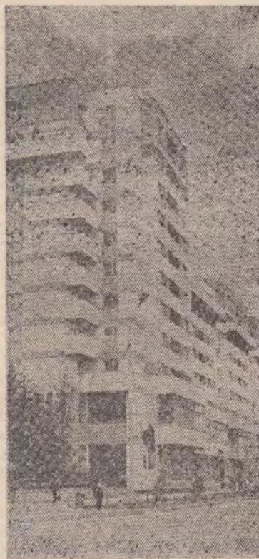
Din noua arhitectură a municipiului Miercurea Ciuc