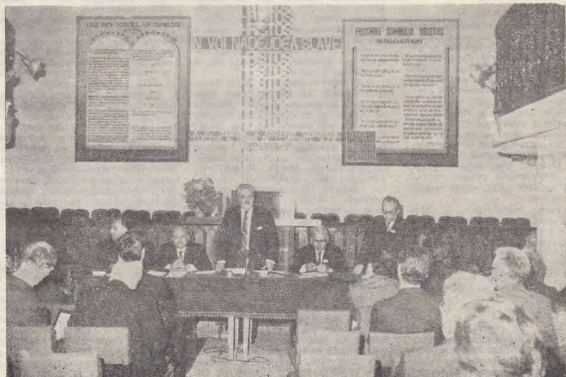
Aspect din timpul raportului Comitetului de Propuneri

„Veți cunoaște adevărul și adevărul vă va face slobozi...“ și de asemenea : „Sfințește-i prin Adevărul Tău, Cuvîntul Tău este Adevărul“ (Ioan 8, 32 ; Ioan 17, 17).