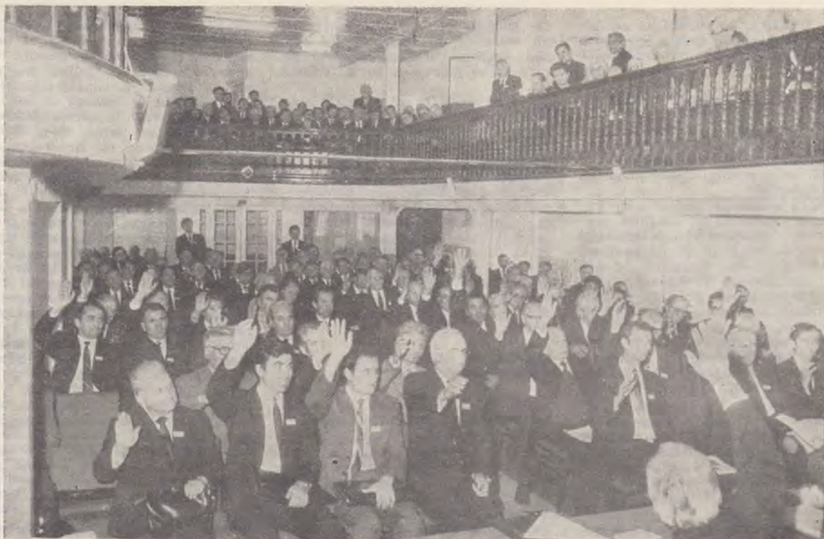
Aspect din sală în timpul votării

Aceasta este chemarea și datoria noastră, iar asigurarea ne este dată: „Și iată că Eu sint cu voi în toate zilele, pînă la sfîrșitul veacului“ (Mat. 28, 20).