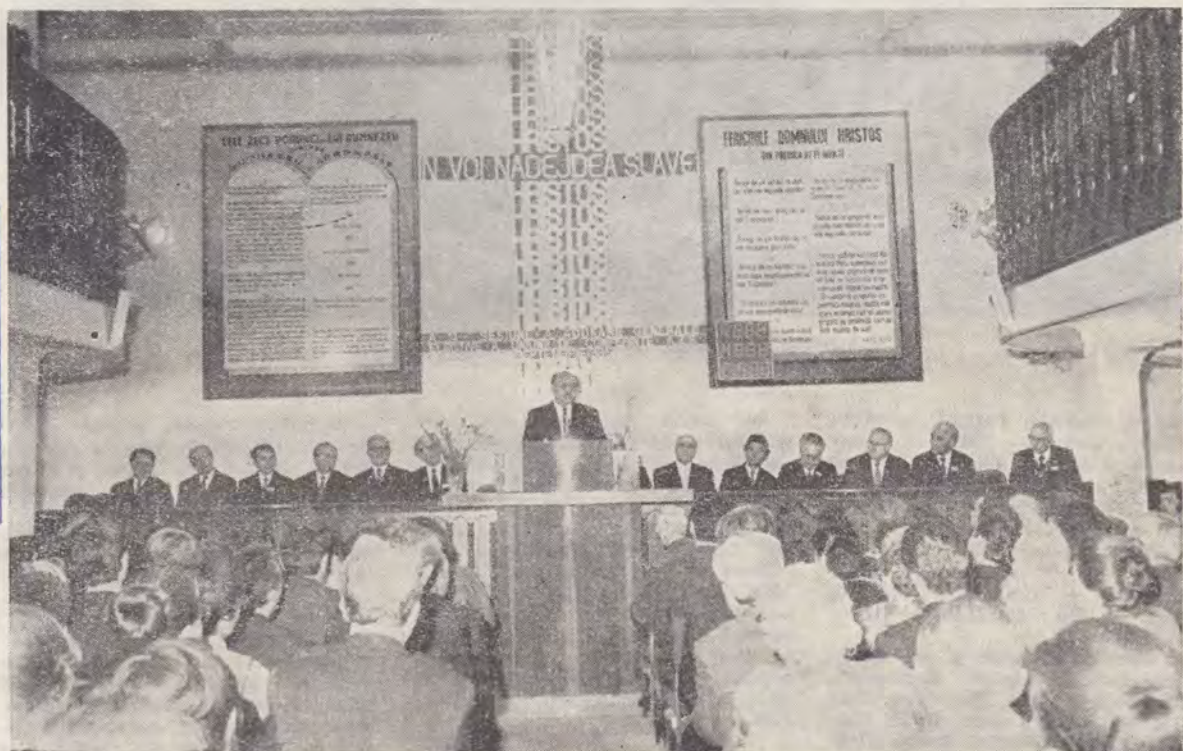
Aspect din timpul serviciului divin din Sabat

Ca unii ce ne numărăm cu grijă anii pribegiei noastre, demonstrîndu-se astfel că sîntem trecători, trebuie să consemnăm aici că de la 20 iulie 1980 și pînă în prezent au adormit în Domnul un număr de 17 slujitori ai lui Dumnezeu.