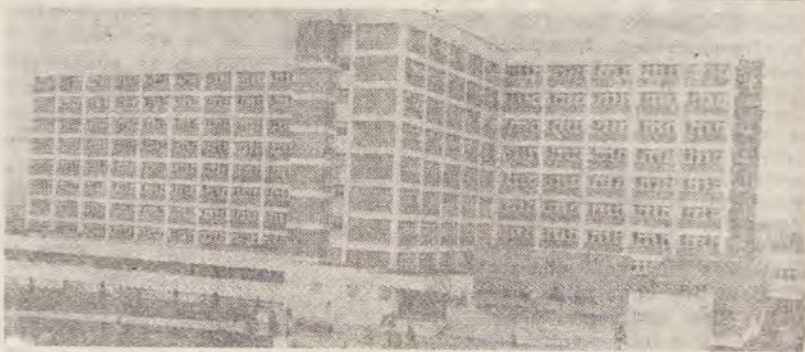
Spitalul Clinic din Tirgu Mureș