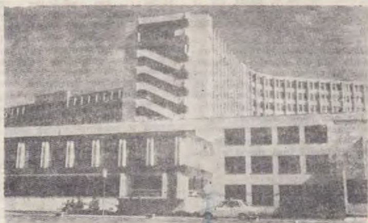
Spitalul din Craiova