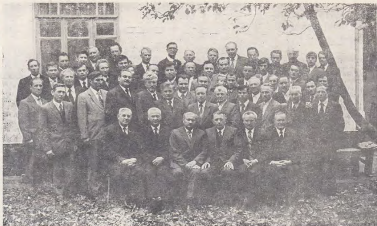
Delegația Bisericii noastre în mijlocul unui grup de pastori din Ucraina